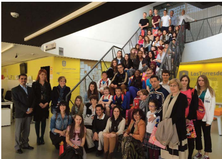
Arriba, los estudiantes de intercambio con el colegio "Susarte". Abajo, los escolares del IES "Salvador Sandoval" en una de sus visitas culturales en Francia.

Alumnos del colegio "Susarte" y del IES "Salvador Sandoval" participan en diferentes experiencias dentro del programa "Comenius"