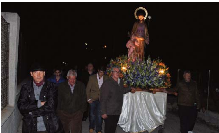
Los vecinos de La Condomina acompañan a su patrón por las calles del barrio.