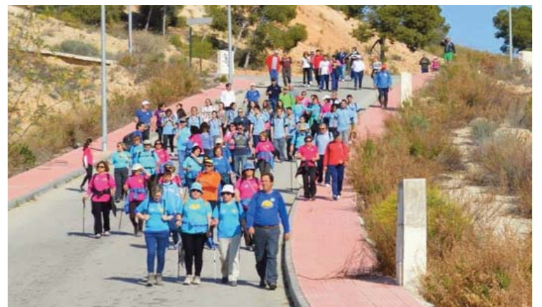
Una parte de la comitiva que participó en el recorrido inaugural de este sendero.

El pasado 16 de marzo se realizó el recorrido inaugural en el “Sendero de los 10.000 pasos” de Las Torres de Cotillas, un proyecto de señalización mediante paneles y balizas en el que ha colaborado la “Asociación para la Integración de Personas con Discapacidad Intelectual CEOM”. “Es un sendero de corto recorrido que une el centro del pueblo con su entorno natural y permite a nuestra localidad sumarse a las ‘Sendas de los 10.000 pasos’ que ya se han puesto en marcha en otras localidades de la Región”, explica el alcalde torreño, Domingo Coronado, que presidió este acto junto a su edil de Deportes,