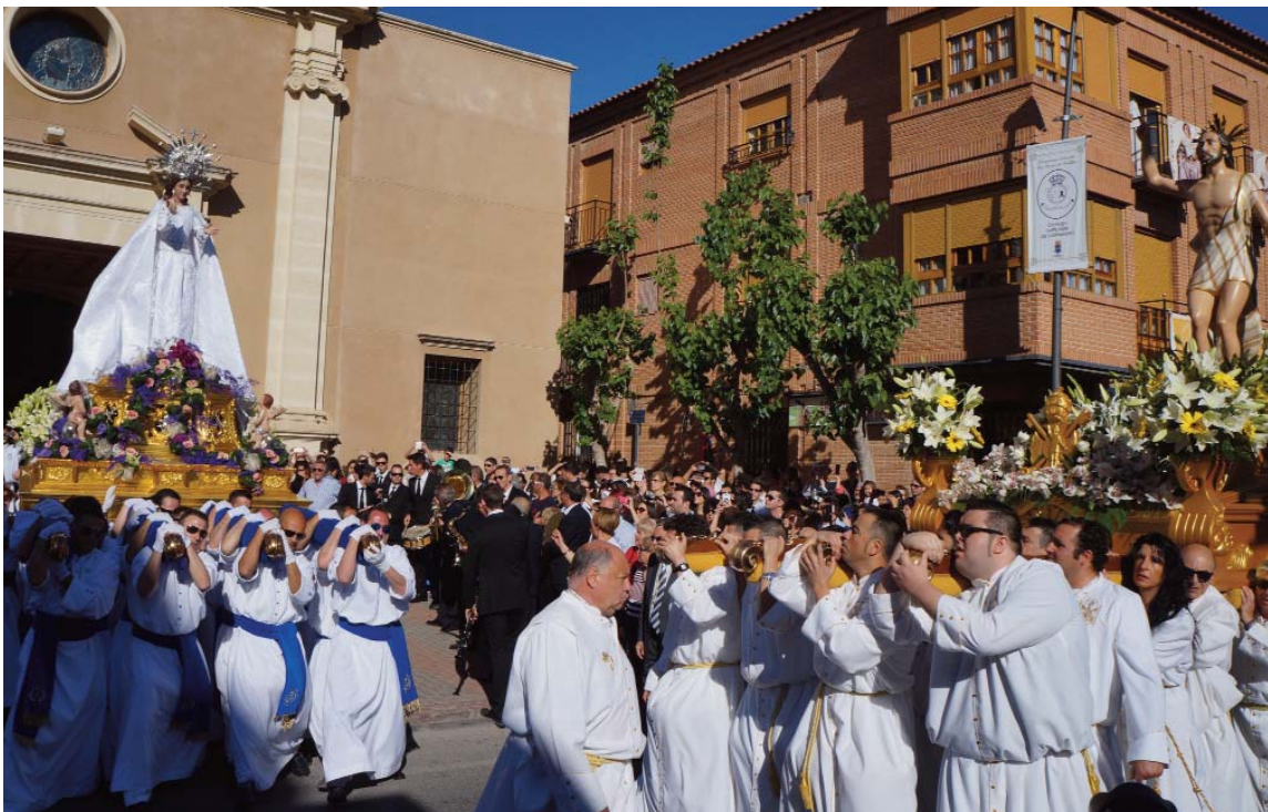
Los desfiles pasionales volvieron un año más a las calles torreñas, como el de Domingo de Resurrección (arriba).

En la soleada mañana del pasado domingo 20 de abril concluían los actos pasionales de la Semana Santa 2014 de Las Torres de Cotillas. Así, a primera hora se celebraba este Domingo de Resurrección una eucaristía en la Parroquia Nuestra Señora de la Salceda, preludeo del tradicional, colorido y multitudinario