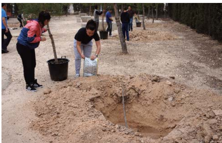
Los escolares torreños, en plena labor de plantación del nuevo arbolado.

Un grupo de alumnos de 4º de Enseñanza Secundaria Obligatoria (ESO) del IES "Salvador Sandoval" de Las Torres de Cotillas participaron el pasado 11 de abril en una actividad extraescolar, que les permitió vivir la experiencia de plantar árboles en el patio exterior de su centro docente. Los jóvenes, acompañados de sus profesores y guía-