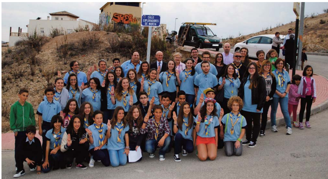
Arriba, la inauguración de la calle Exploradores de Murcia. Abajo, la dedicada a Nelson Mandela.

El Ayuntamiento le ha dado su nombre a sendas calles en el municipio