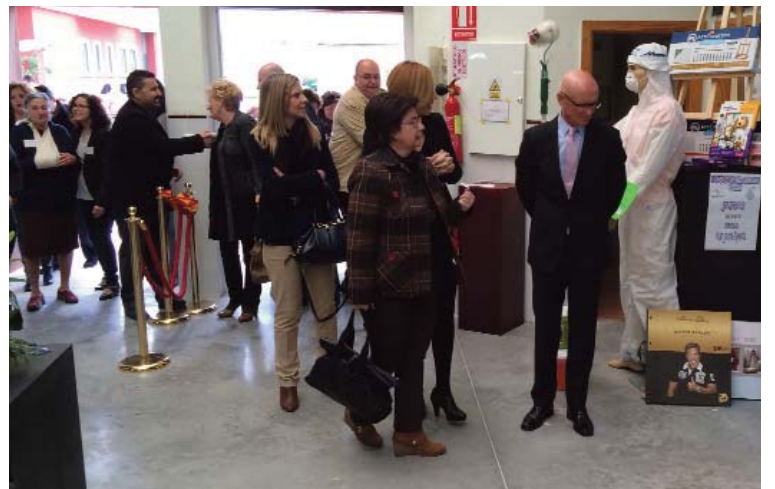
Las autoridades visitaron los diferentes stands el día de la inauguración.

Tuvo lugar en el Centro de Jóvenes Artistas y reunió un total de 19 stands de comercios locales femeninos