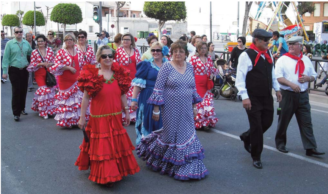
Las calles de Las Torres de Cotillas volvieron a llenarse de trajes de flamenca y de campero junto a la Virgen del Rocío.

La “Peña Rincón Pulpitero” celebró una nueva edición de su “Romería Rociera”