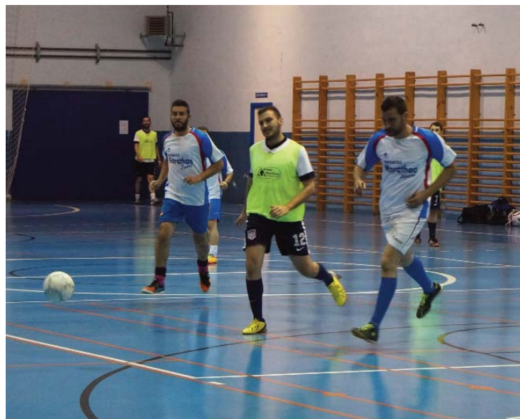
El ganador de la final de consolación fue el “Deportes Marathon”.

La pista del Pabellón Polideportivo Municipal de Las Torres de Cotillas fue escenario el pasado 14 de abril de 2014 de los partidos finales del campeonato local de fútbol sala, que -organizado por la “Asociación Las Torres Deportivas” en colaboración con la Concejalía de Deportes torreña- cumplía este año su 17ª edición. El gran campeón fue “Peluquería Clemente”, que ganó en la final por un contundente 7-2 a “Restaurante Casa Duque” y confirmó su dominio de la liga regular. Por su parte, en la final de consolación se impuso “Deportes Marathon” al “Estrella Roja de Zancovia” (4-2).