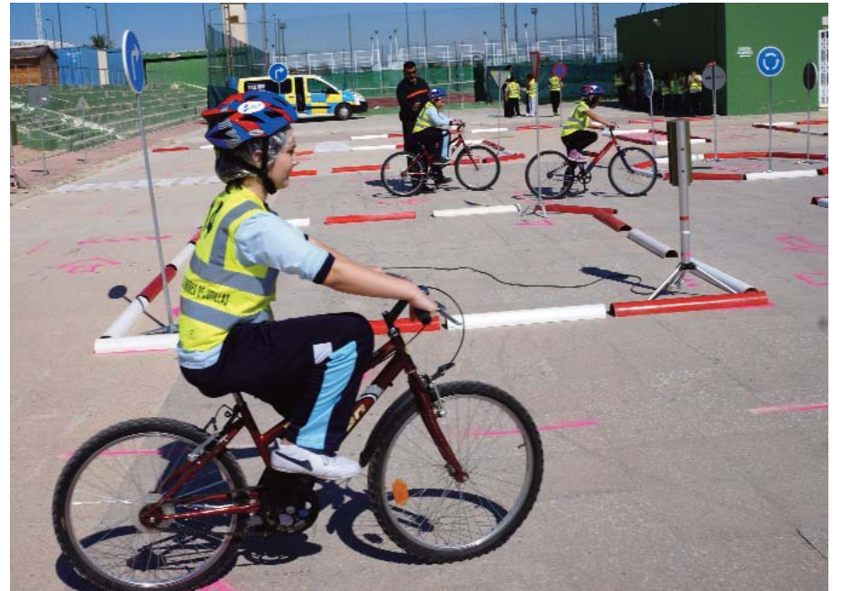
Los escolares torreños aprendieron educación vial un curso más con las clases teóricas y prácticas de esta campaña.