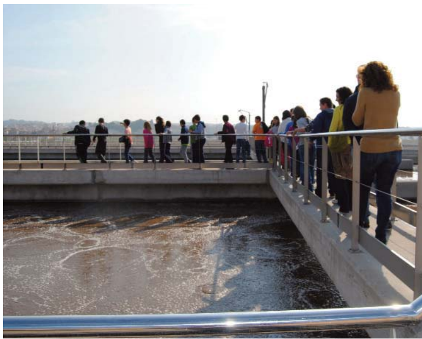
Los escolares, en plena visita a las instalaciones de la depuradora municipal.

Así, esta iniciativa constaba de dos campañas diferenciadas. Por un lado, una de reciclaje selectivo que se realiza desde 2006, se dirigía a escolares de 4º de Primaria y en la que se