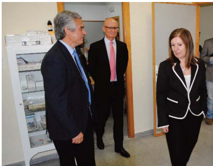
Las autoridades, en la visita inaugural a estas nuevas instalaciones sanitarias.

El nuevo SUAP torreño tiene una superficie total de casi 275 metros cuadrados, repartidos en dos plantas, dispone de una recepción, cinco consultas, una sala de espera, un almacén, un aseo y una sala de usos múltiples, en la planta baja, además