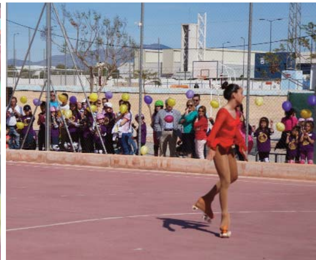
A la izq., la chavalería se agolpa para empezar la ruta urbana por el municipio. A la dcha., uno de los números de exhibición de patinaje artístico de la jornada.

puesta tanto de participantes como de público nos hace pensar que esta cita empieza ya a