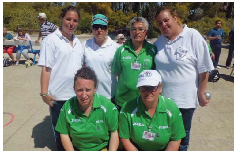
Las torreñas posan en Mazarrón en el torneo donde se proclamaron campeonas.

El equipo femenino del “Club Peltanca La Salceda” de Las Torres de Cotillas se proclamó campeón regional en el torneo disputado en Mazarrón. Con este