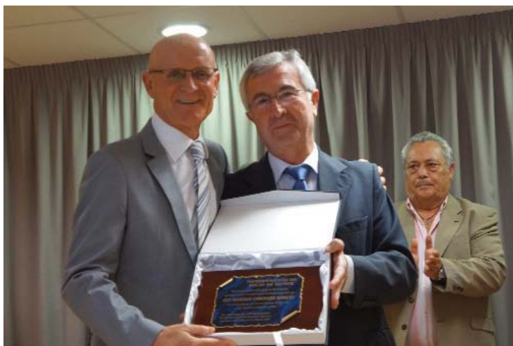
El primer edil torreño, con su placa distintiva como "Socio de Honor" del centro.

El alcalde de Las Torres de Cotillas recibió esta distinción durante la pasada "Semana Cultural", que ofreció diversos actos