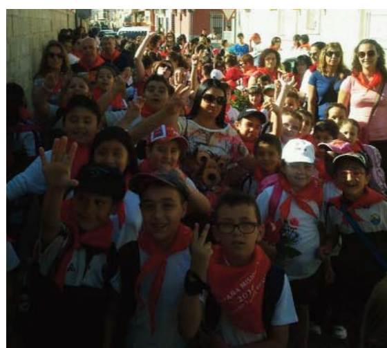
Los niños del “Divino Maestro”, durante la romería.

Los escolares del colegio “Divino Maestro” torreño participaron el pasado 2 de mayo en una romería solidaria, que partió desde el propio centro educativo y tuvo como final la Iglesia de Nuestra Señora de la Salceda. Con la participación de cerca de 300 niños, esta iniciativa buscaba recaudar fondos para la campaña misionera del colegio torreño, que bajo el lema “Enciende