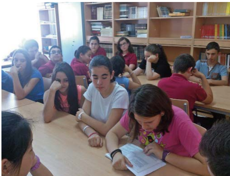
A la izq., un momento de la charla celebrada en el colegio "Susarte". A la dcha., el acto celebrado en la Casa de la Cultura.