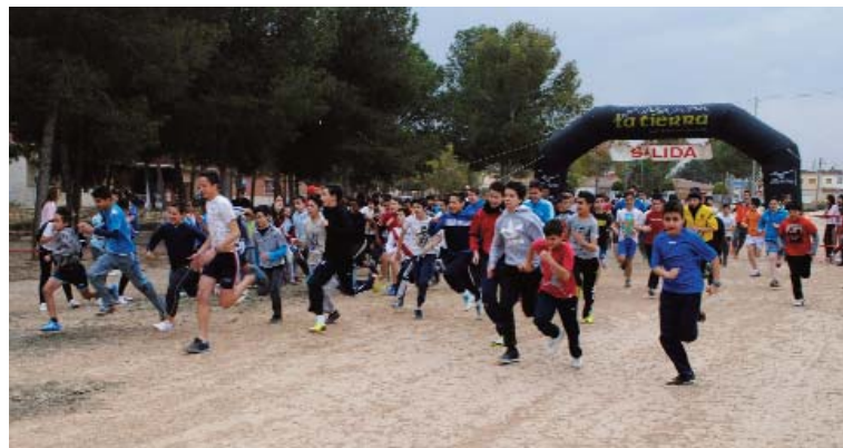
Cerca de 700 escolares participaron en esta tradicional prueba deportiva.

El colegio "Susarte" fue el gran vencedor del cross escolar 2014 de Las Torres de Cotillas, ya sus escolares llegaron a colgarse cuatro medallas de oro en las ocho categorías disputadas. La prueba se celebró el pasado 12 de marzo en los terrenos del parque de "La Emisora" del municipio y se disputó en las modalidades masculina y feme-