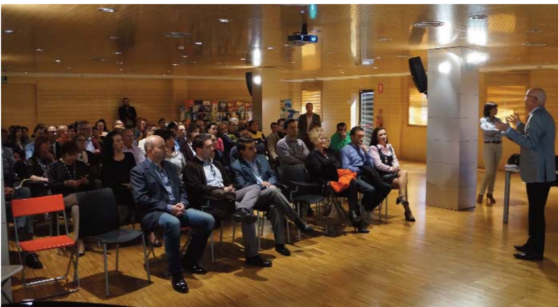
Un momento de la exposición del alcalde torreño en esta jornada celebrada en la empresa local “Linasa”.

Organizada por la Concejalía de Control de Gestión, Calidad, Formación y Comunicación Interna local, tuvo lugar en las instalaciones de “Linasa”