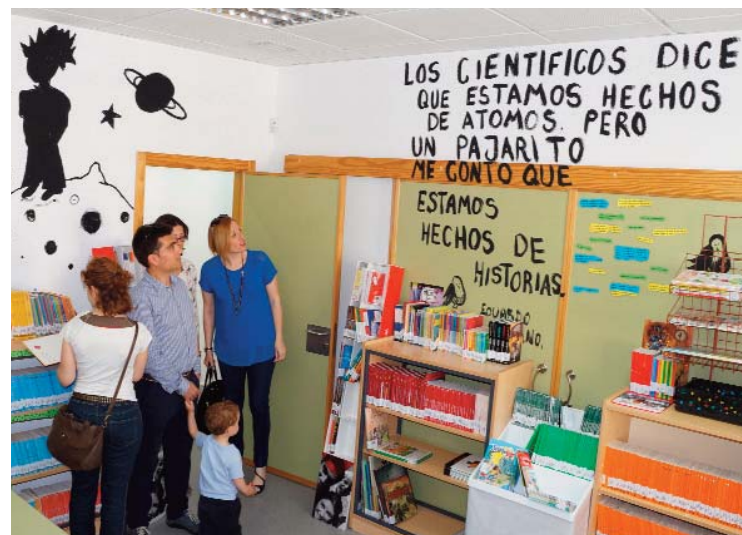
La nueva biblioteca del colegio "Joaquín Cantero" se llama "Cultivacocos".