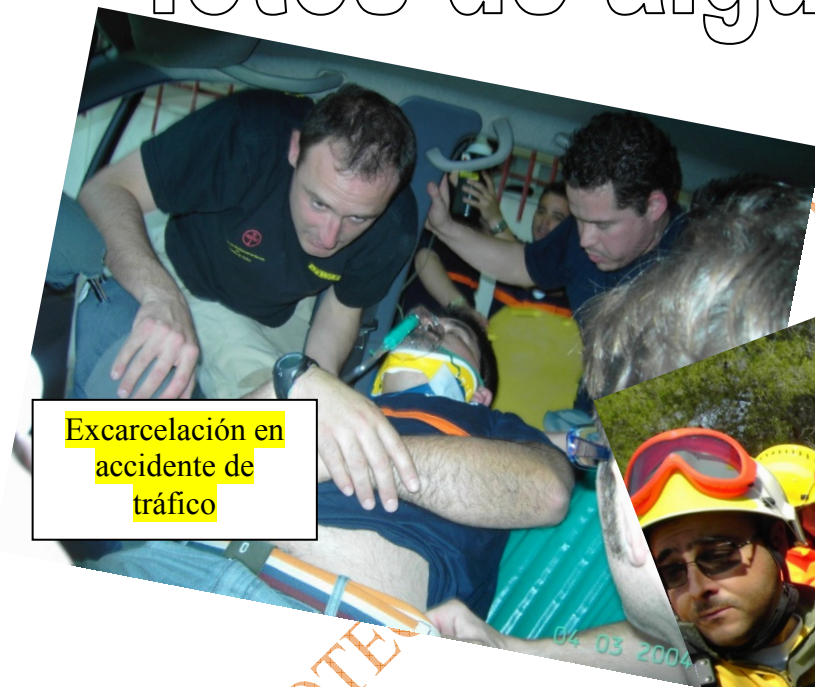
Excarcelación en accidente de tráfico