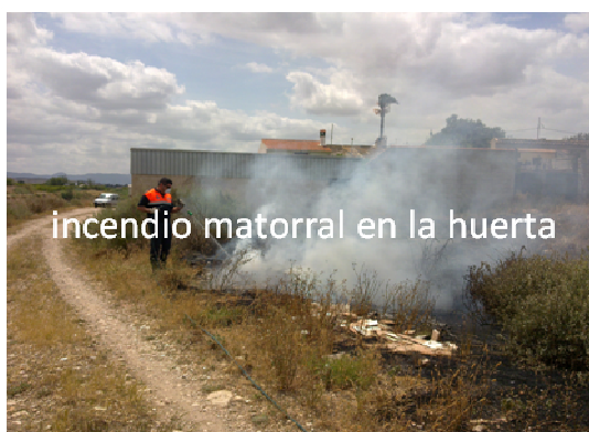
incendio matorral en la huerta