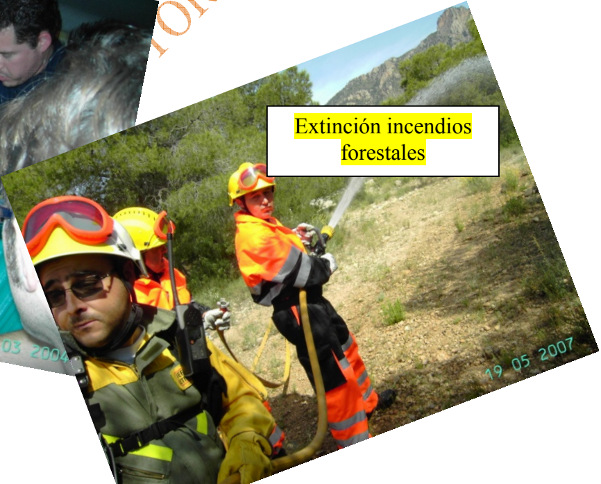
Extinción incendios forestales