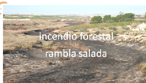
incendio forestal rambla salada